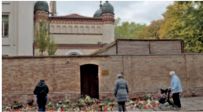
v.l.: KZ-Gedenkstätte Mauthausen, Blumen und Kerzen an der Synagoge in Halle (9.10.2019)