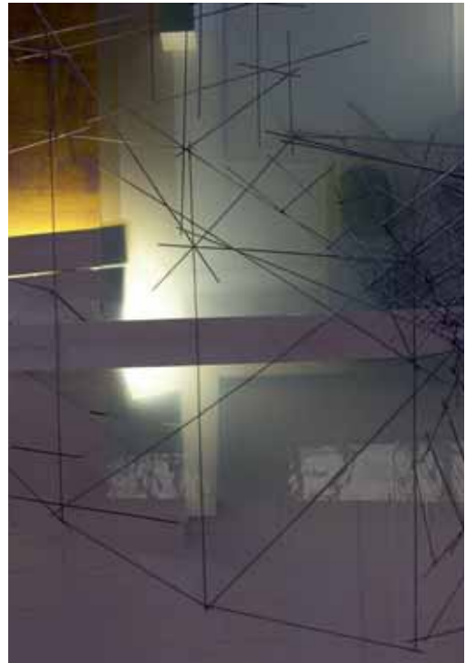
Lukas Derow, Jakobsleiter (Ausschnitt), Altarwand St. Jakobus

Außerdem finden im Oktober zwei Akzente-Gottesdienste statt, die sich in St. Jakobus besser bzw. nur dort durchführen lassen: