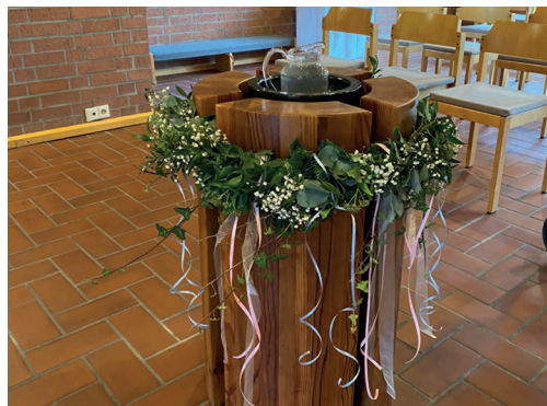
Taufbecken in der Markuskirche