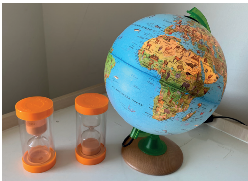
Materialspenden für die Riesenglück-Forscher