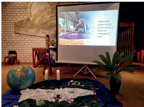
Weltgebetstag 2026 in Mainaschaff