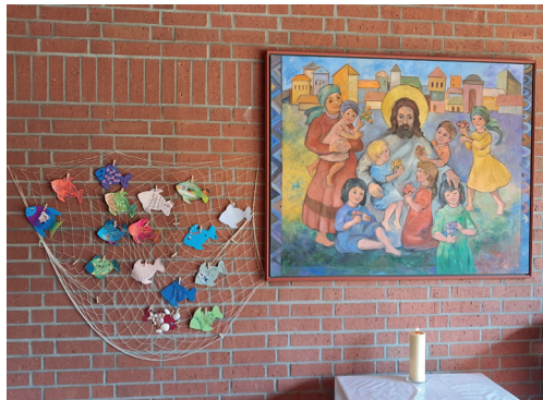
Taufe in der Markukirche