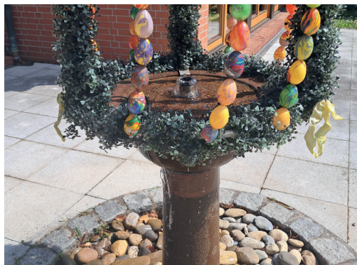
Osterbrunnen in Kleinostheim