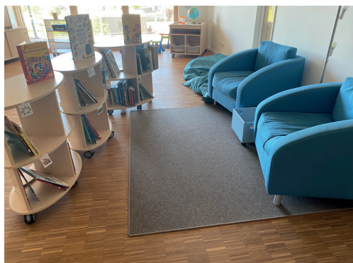
Forscherraum in der Kita Riesenglück