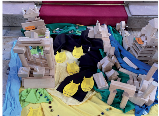
Ökum. Kinderbibeltag in Stockstadt