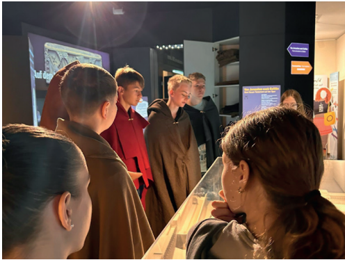
Konfirmanden im Bibelmuseum